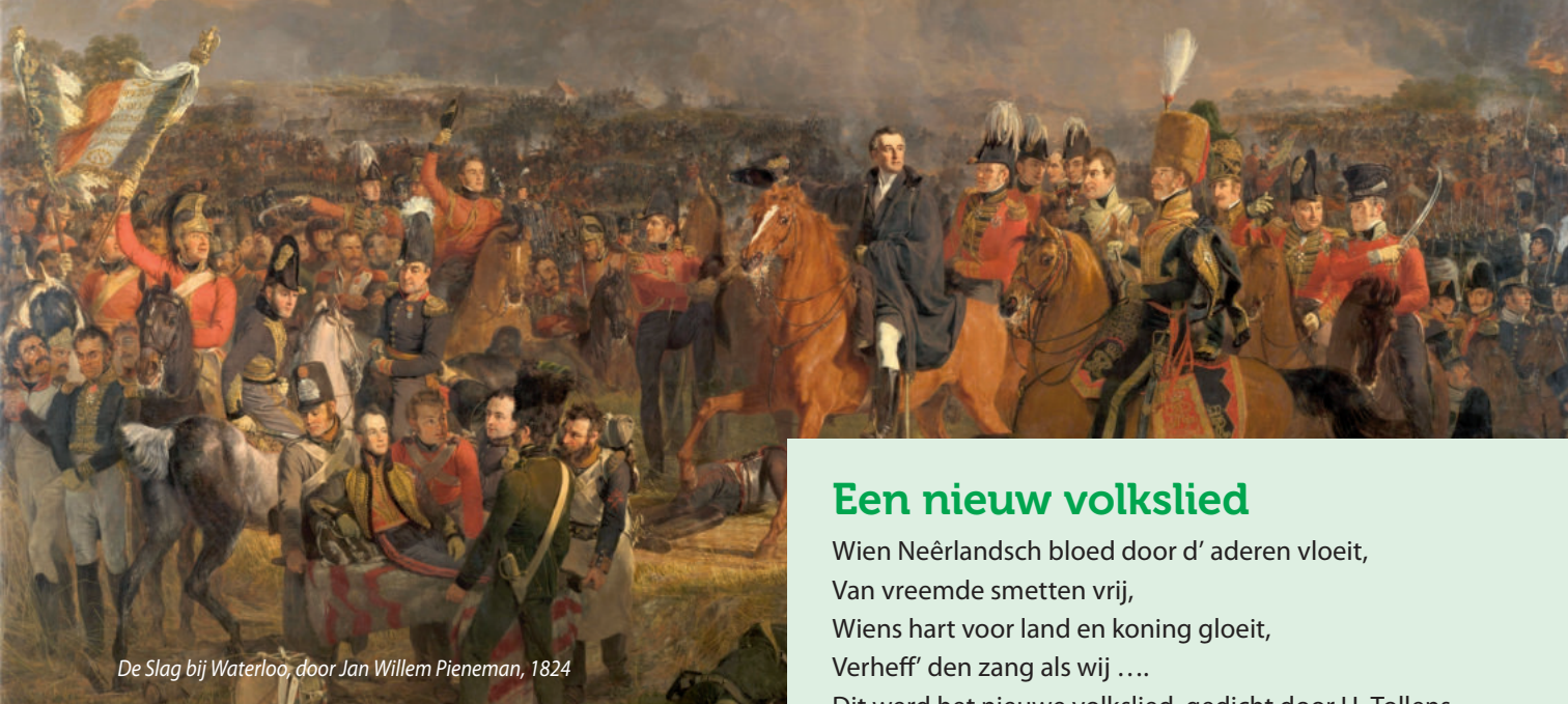
De Slag bij Waterloo, door Jan Willem Pieneman, 1824

De armoede in Nederland werd er helaas niet minder van. Te weinig mensen begrepen dat de afnemende handel, de verouderde industrie en de lage lonen de oorzaak waren.