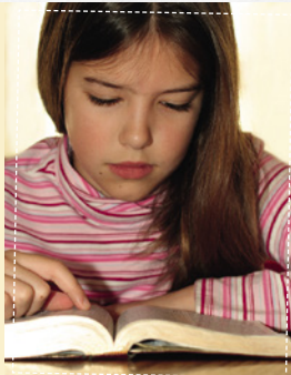
Bijbellezen aan tafel