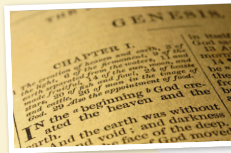
Genesis 1 in de King James Bible

Op last van koning Jacobus (James) van Engeland werd de Bijbel vanuit het Hebreeuws en Grieks vertaald. Aan deze vertaling in het Engels werkten 54 geleerden. Vooral in Schotland, de Verenigde Staten en Australië wordt de King James Bijbel gebruikt. Wij noemen het wel de Engelse 'Statenbijbel'.