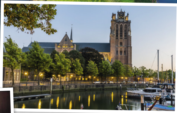
Grote Kerk te Dordrecht

Midden in de zaal zaten de remonstranten. Zij protesteerden steeds tegen de manier waarop de synode zou vergaderen. Zo probeerden ze te voorkomen dat de inhoud van hun remonstrantie