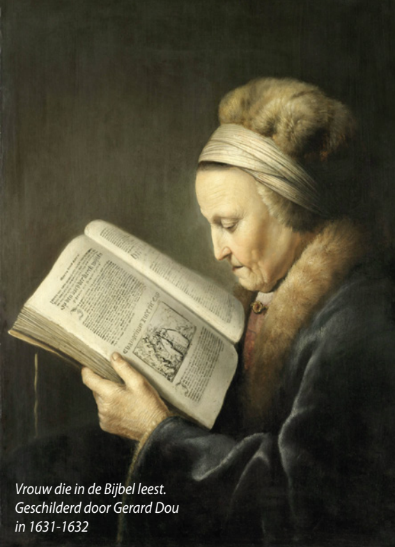
Vrouw die in de Bijbel leest. Geschilderd door Gerard Dou in 1631-1632

dat bij een huwelijksbevestiging gelezen wordt. In mei 1619 was de Nationale Synode van Dordrecht afgelopen.