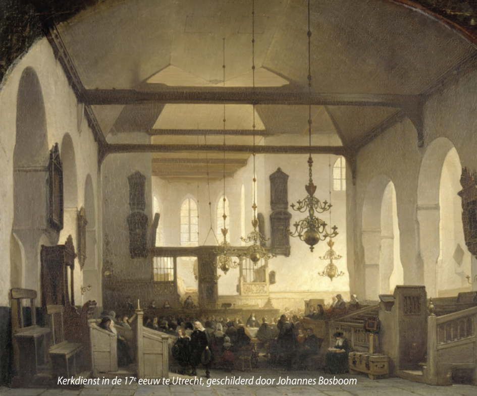
Kerkdienst in de 17 e eeuw te Utrecht, geschilderd door Johannes Bosboom