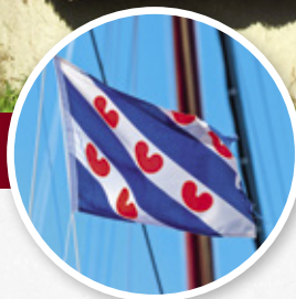
De Friese vlag wappert fier in de wind