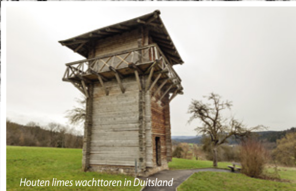
Houten limes wachttorens in Duitsland