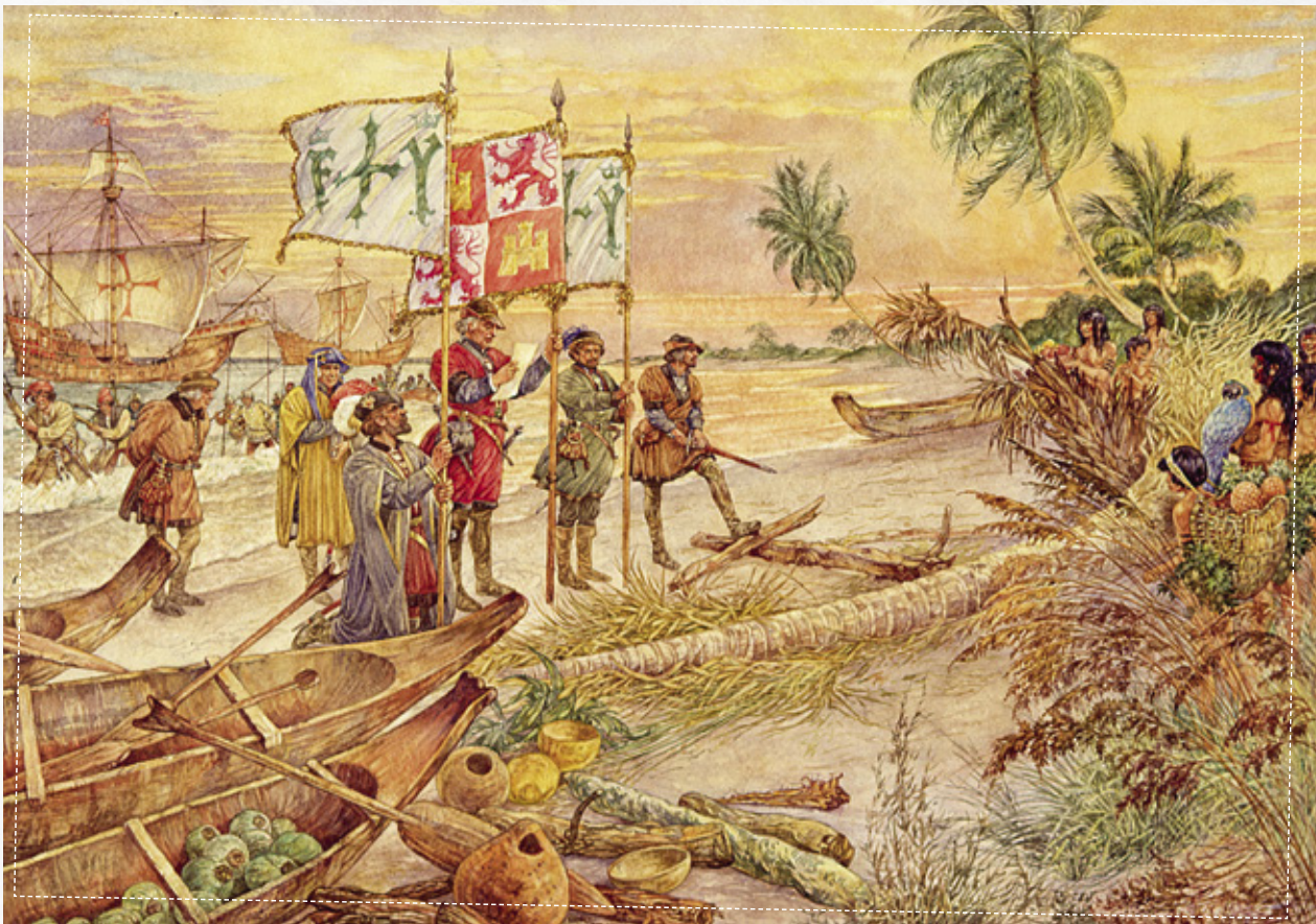
Columbus en de Indianen