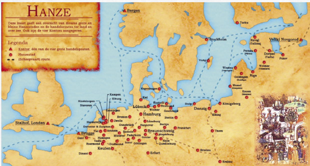
Kaart van de Hanzesteden en handelsroutes