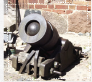
Een van de oudste kanonnen

Omstreeks het jaar 1300 werd het buskruit uitgevonden. Dat gaf een hele verandering in de oorlogsvoering. Het buskruit werd gebruikt om kogels weg te schieten met een soort geweer. Daar was geen harnas tegen bestand.